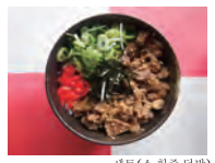
세트(소 힘줄 덮밥)