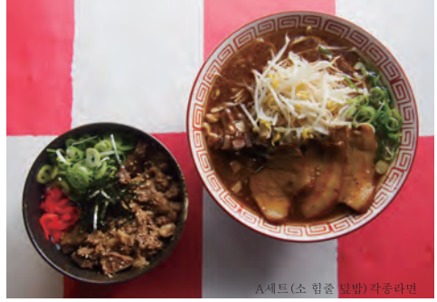
A세트(소 힘줄 덮밥) 각종라면