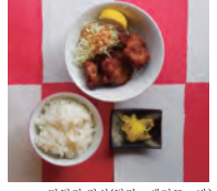
닭튀김 정식(튀김 + 샐러드 + 밥)