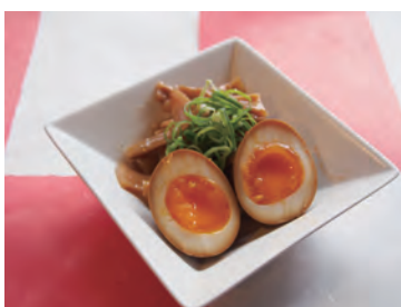
Sungan and Seasoned egg 350yen メンマと煮玉子