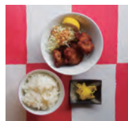
炸鸡套餐 (炸鸡・沙拉・米饭)