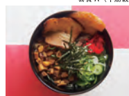
套餐 B (叉烧饭)