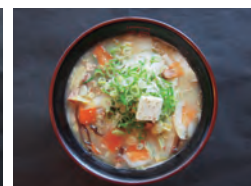
蔬菜拉面 1000 可以补充人体一日所需的蔬菜的量的半 推荐蔬菜摄入不足的顾客品尝 免费可加黄油 采用时令蔬菜