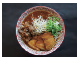
牛筋拉面 1000 使用国产牛筋肉 甜辣口味