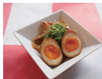
煮竹笋 350日元 醤油煮鸡蛋

青毛豆 枝豆 250 凉拌豆腐 冷奴 300 辣凉拌豆腐 ビリ辛冷奴 300 炸薯条 フライドポテト 300 炸鸡翅 フライドチキン 300 叉烧 チャーシュー盛り 500 炸章鱼 たこの唐揚げ 500