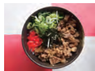
套餐 A (牛筋饭)