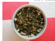
套餐 C (叉烧饭)