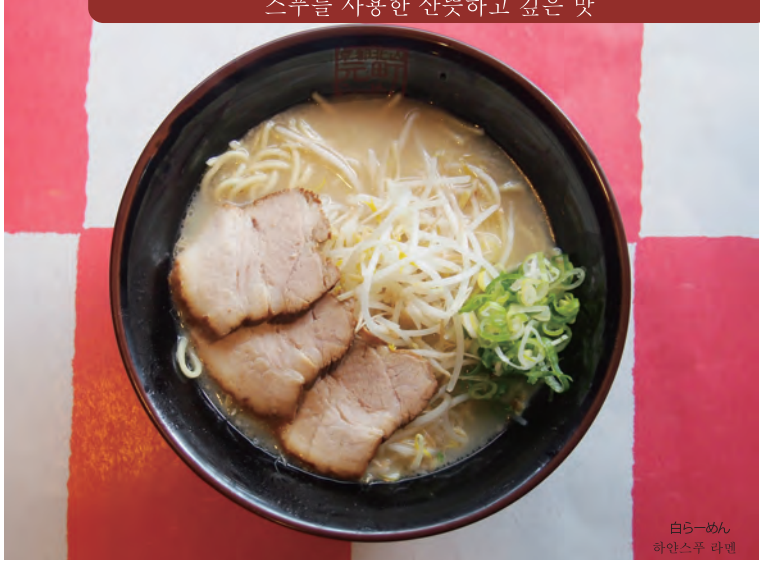
白らーめん 하얀스푸 라멘