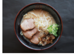
소고기 힘줄 (牛스지) 라멘 950원 하얀스푸