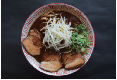
라멘 700원 차슈 라멘 950원