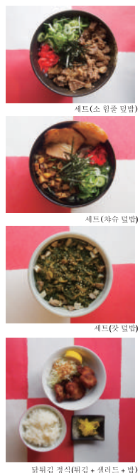
닭튀김 정식(튀김 + 샐러드 + 밥)