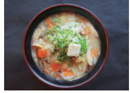
야채 라멘 950원 하얀스푸라멘에 야채를 듬뿍 넣어 짬뽕같은 라멘 하루 필요한 야채섭취량의 절반이 들어있습니다

토픽 생 마늘 추가 무료 날계란 : +50 원 계란 장조림 (니타마고) : +100 원 면 곱빼기 : +100 원 가는 면으로 변경 가능