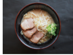
하얀스푸 라멘 700원 하얀스푸 차슈 라멘 950원