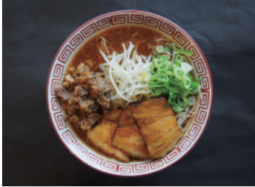
소고기 힘줄 (牛스지) 라멘 950원