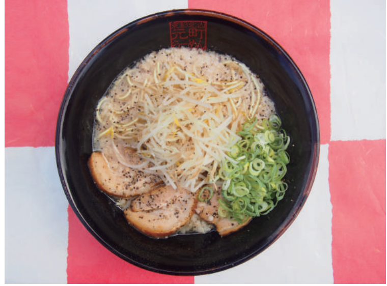
후추 라멘 750원